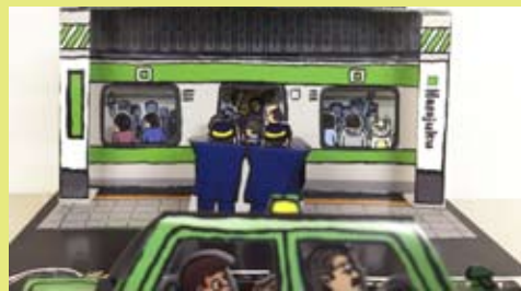
山手線の満員電車